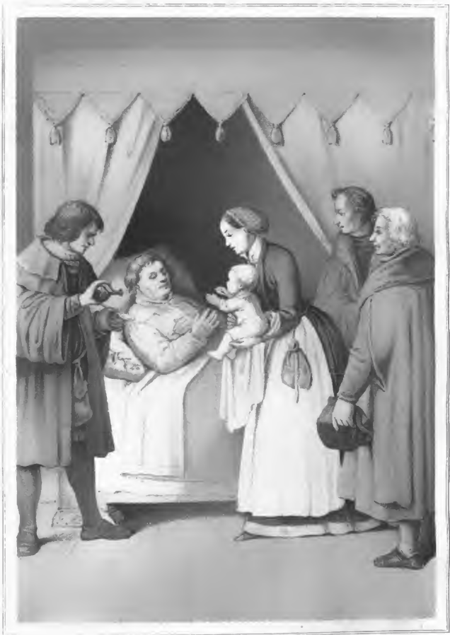
Lithogr. u. Druck v. Lehmann & Voigt in Dresden